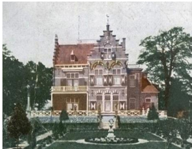
De villa in neorenaissance stijl

In 1975 kreeg de het gebied van de Darthuizerberg de status van natuurgebied en kwam het in handen van Staatsbosbeheer. Staatsbosbeheer heeft oude restanten van het landgoed weer zichtbaar gemaakt.