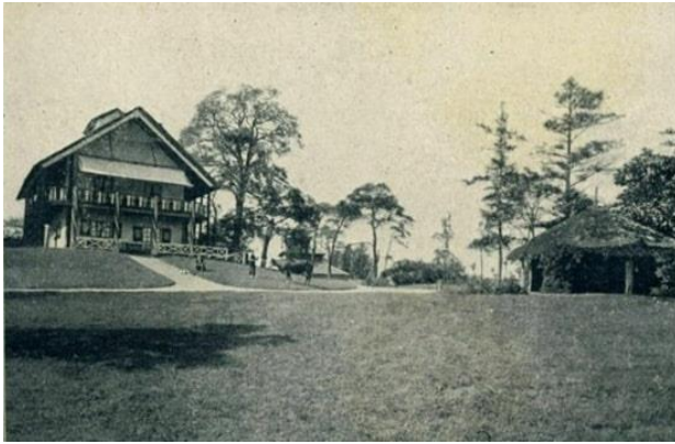
Het "Zwitserse huis"

en werd daardoor in de volksmond het Zwitserse huis genoemd. Bij de villa legde men een Engelse landschapstuin aan.