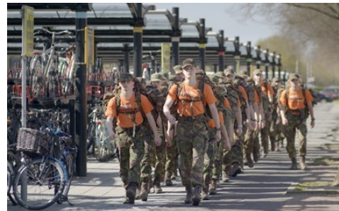
Studenten van ROC Nijmegen

Op vrijdag 16 juni a.s. vindt de 3e editie plaats van het inmiddels landelijke evenement VeVa Marcheert! Op 23 locaties verspreid over heel Nederland, zullen zo'n 2.400 studenten van de MBO-opleiding Veiligheid en Vakmanschap (VeVa) een mars lopen. Daarmee kondigen zij onze nationale Veteranendag aan en dragen zij bij aan de erkenning en waardering voor onze helden.