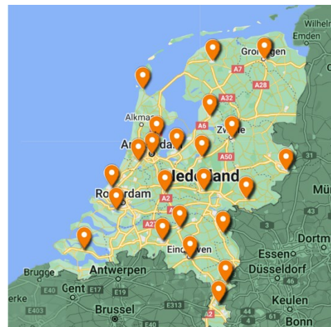
23 locaties verspreid over Nederland